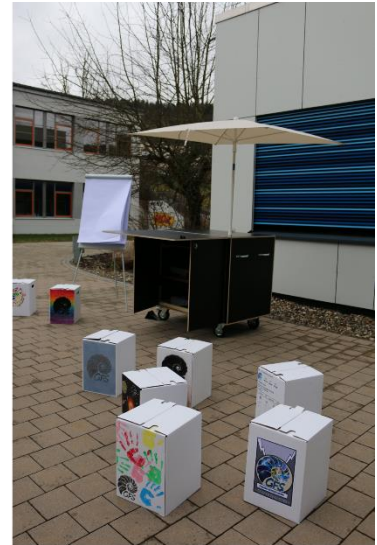
Schirm spannen und fertig!