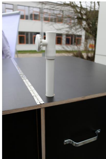
Unterstock in MoCoWO.